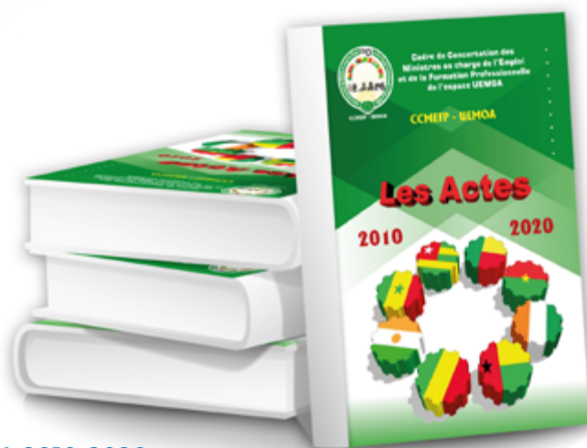
Les Actes - CCMEFP-UEMOA 2010-2020