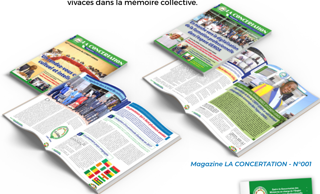
Magazine LA CONCERTATION - N°001

Un évènement majeur qui a également consolidé la notoriété du CCMEFP-UEMOA est bien la célébration des 10 ans du CCMEFP-UEMOA. Une célébration inoubliable dont les souvenirs restent vivaces dans la mémoire collective.